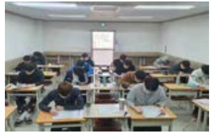
주말 모의고사 시간