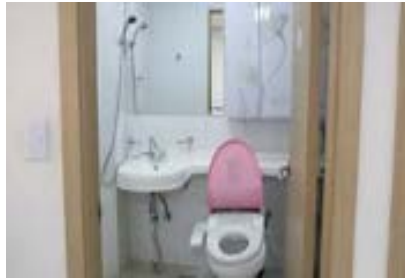
숙소내 욕실 (비데설치)