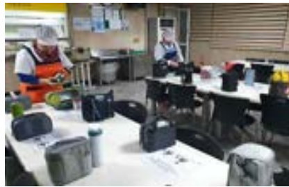
수능 당일 새벽 도시락 준비