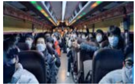
수능 당일 아침 고사장으로~