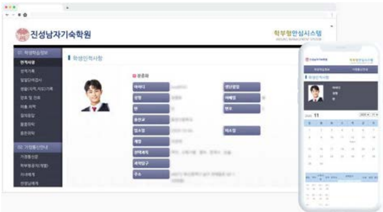
▲ 본원 홈페이지 학부모 안심시스템 로그인 예시 화면 (PC 또는 스마트폰)