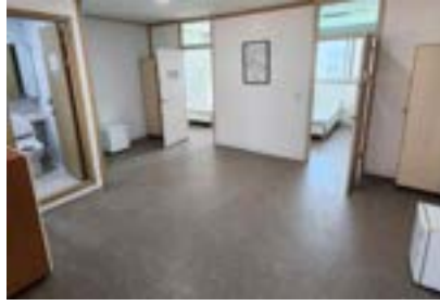
숙소 (2인 1실, 개인사물함, 냉장고비치)