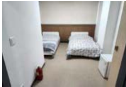
숙소 (2인 1실, 개인사물함, 냉장고비치)