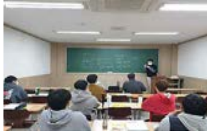
소수 반편성 수업 (반당 15명 내외)